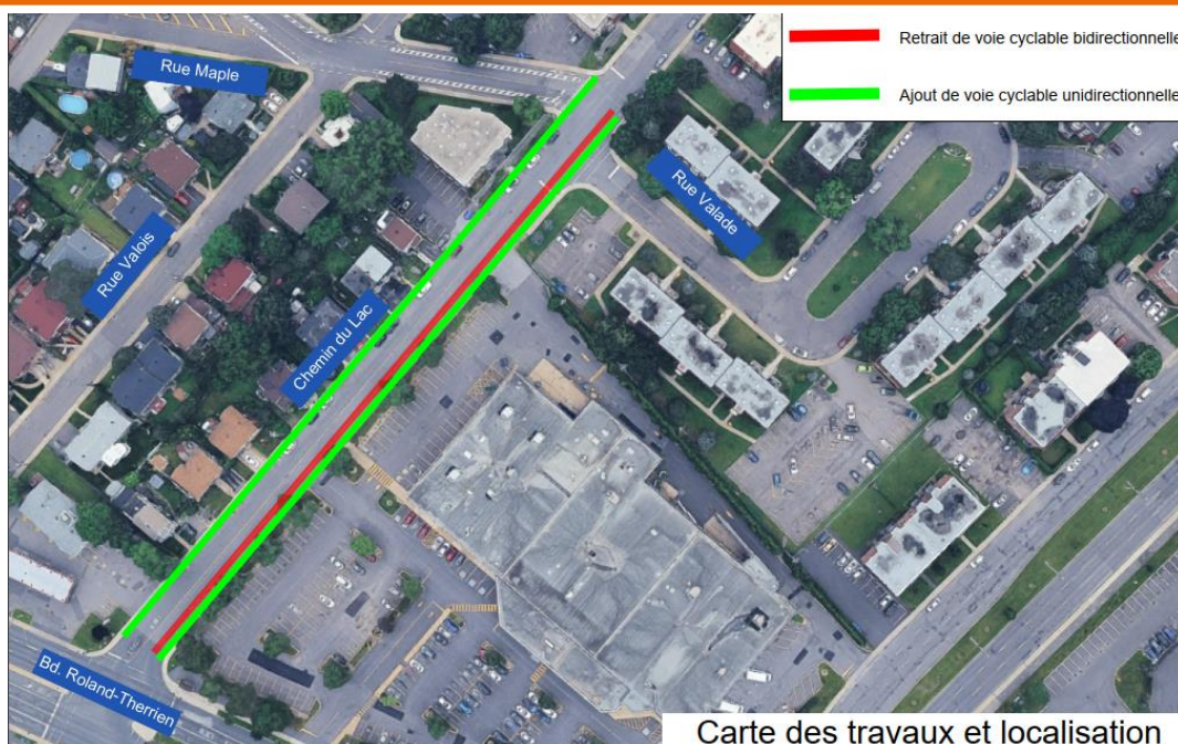
Carte des travaux et localisation