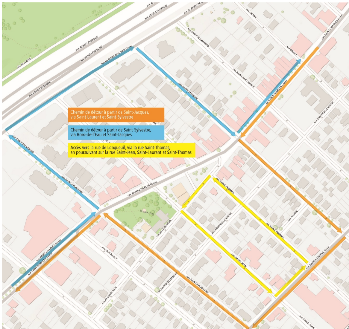
Carte 2 Chemins de détour pour contourner la fermeture de la rue Saint-Charles entre Saint-Sylvestre et Saint-Jacques