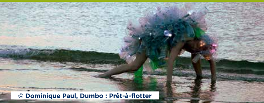
© Dominique Paul, Dumbo : Prêt-à-flotter