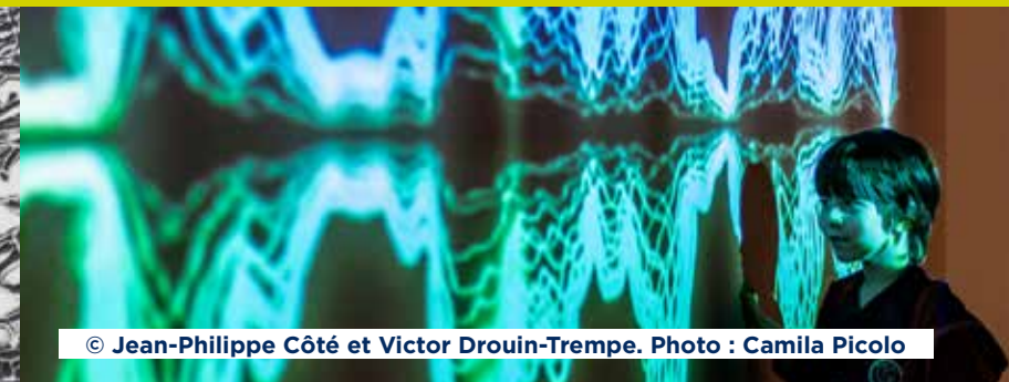
© Jean-Philippe Côté et Victor Drouin-Trempe.

Vernissage : jeudi 1 er février, 18 h Salle B Rencontre avec l'artiste : samedi 6 avril, 14 h