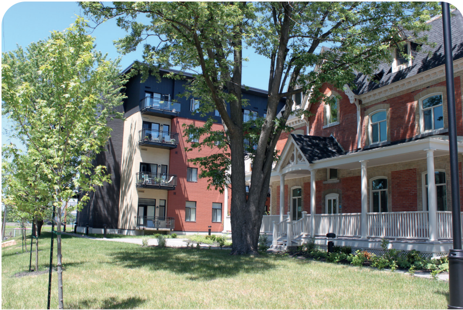
LES HABITATIONS PAUL-PRATT, LE MANOIR